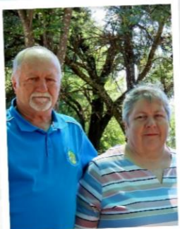
Sieg en Annatjie