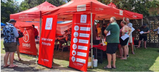
Die Bloedbank was ook by die fees en heelwat mense het bloed geskenk