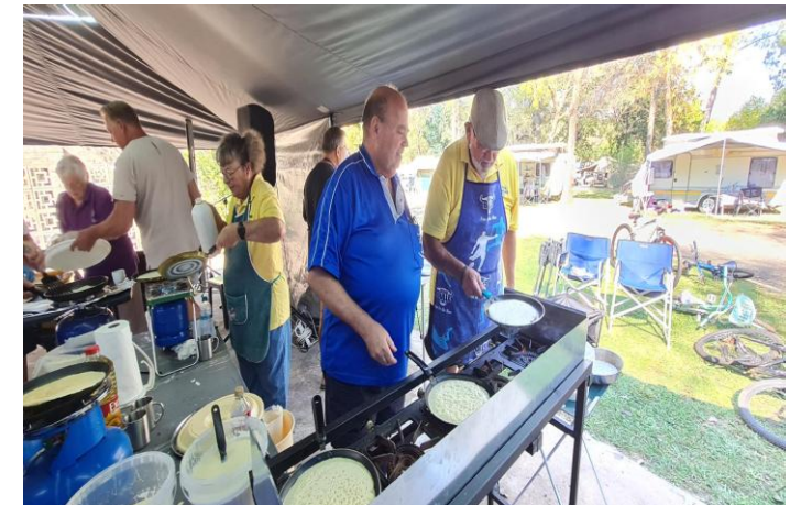
13 Hier word hard pannekoek gebak