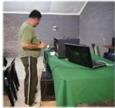
Soos gewoonlik was ons “dj” weer op sy pos.