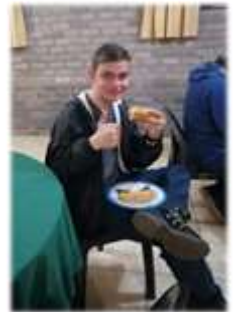
Lekker man, lekker!! Hallo SAWA- vriende,

Buite was dit maar lekker koud en het die meeste mense in die saal saamgekuier. Daar was gou-gou plan gemaak om bietjie warmte in die lyf te kry.