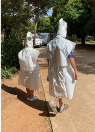
Spoke op die uitvaart om die Klaasens te groet.