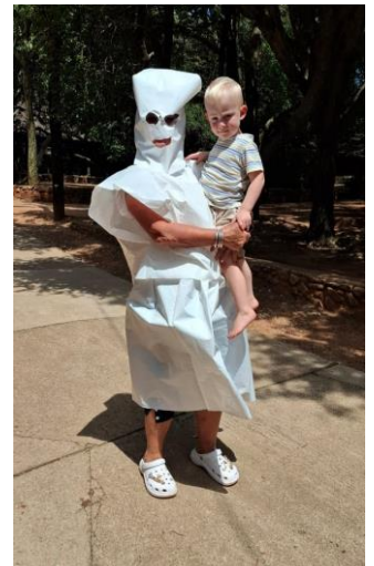
Darius dink ook dis 'n lekker ontmoeting.