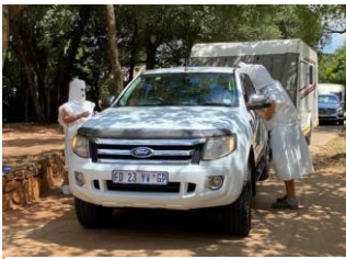
Die Engelbrechts gegroet