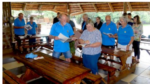
Samesang tydens boekevat