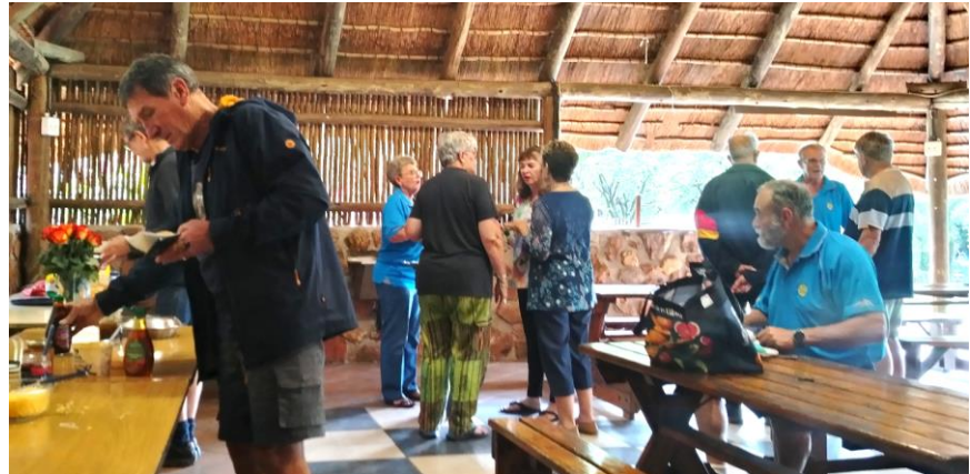
Met die reënigerige weer, was die lapa baie handig, maar gelukkig nie noodsaaklik nie