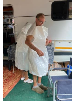
Bertus-hulle neem 'n blaaskans