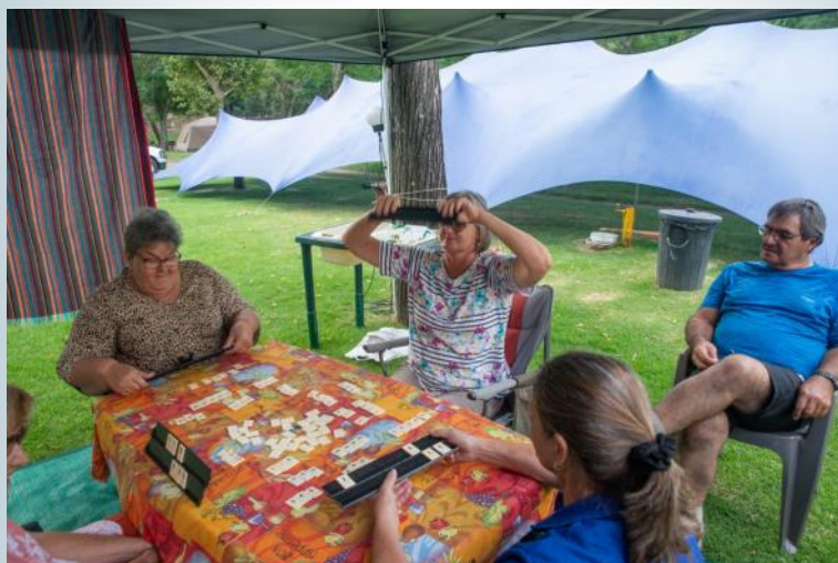
Daar word speletjies gespeel.