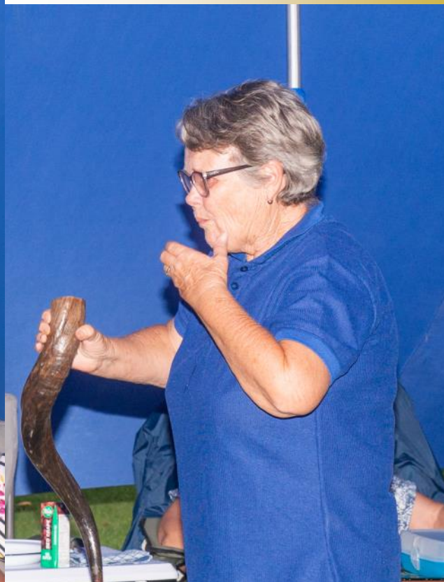
So is dit toe Ohna Oosthuizen wat moet kom sluk.