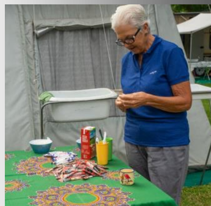
Suidwes-Kaap het 'n ontbyt reg vir die wat gekoop het. Daar is koffie ook.