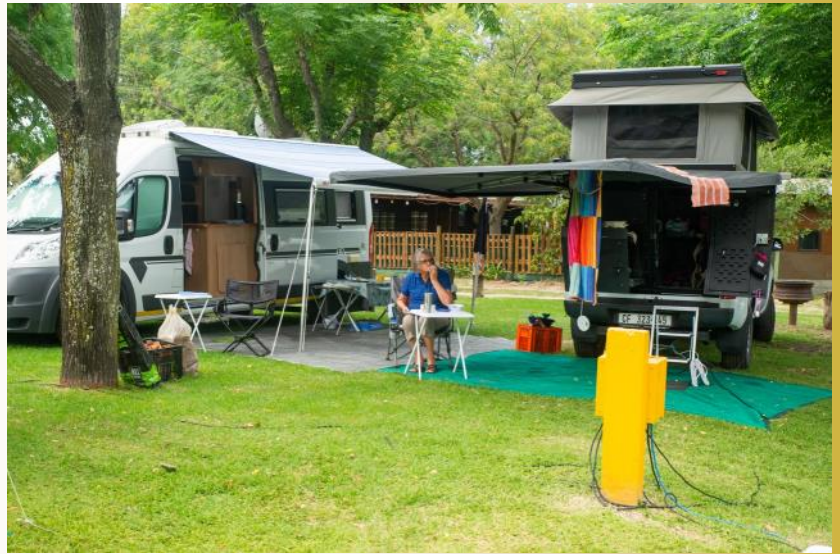
Saterdagoggend is nog 'n mooi dag. Later die dag begin dit toetrek.