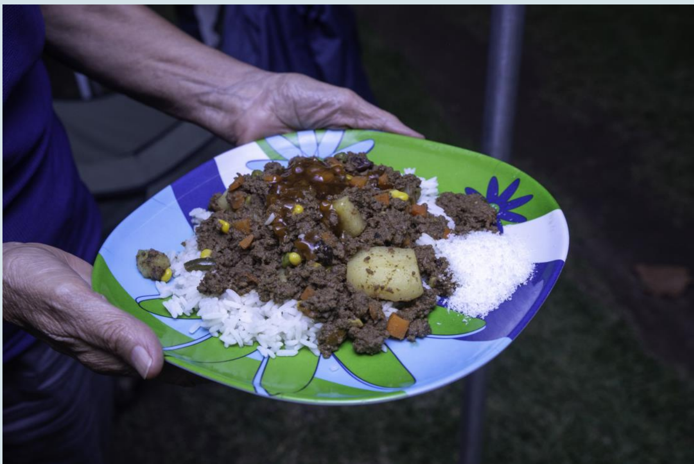
Kerrie en rys, dan is daar klapper en blatjang vir so ekstra smaak.