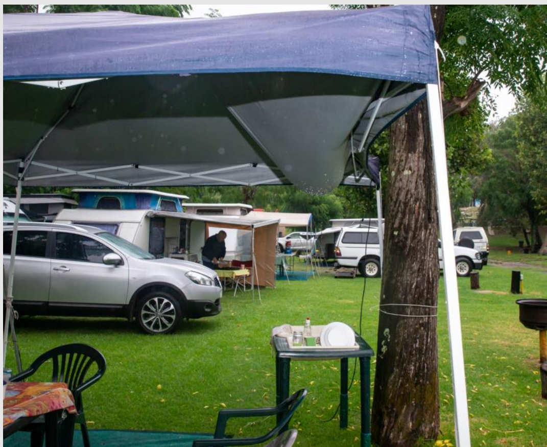
Saterdag nag het dit goed gereën; daar was selfs donderweer ook. Kyk hoe het die reënwater opgedam in Riaan en Petro Steyn se gazebo.