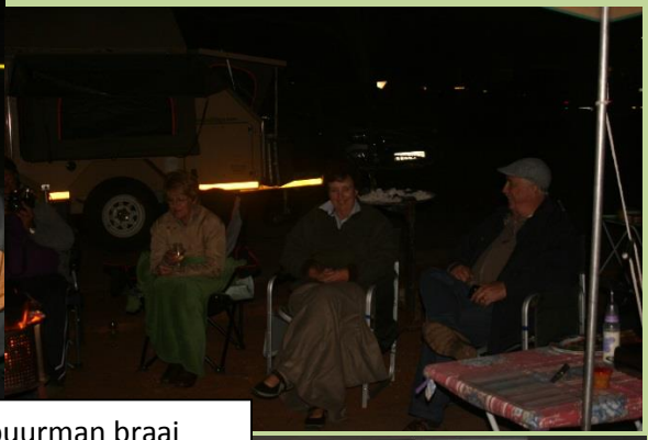
Saterdagagaand buurman braai