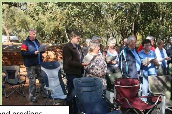
Sondag oggend erediens