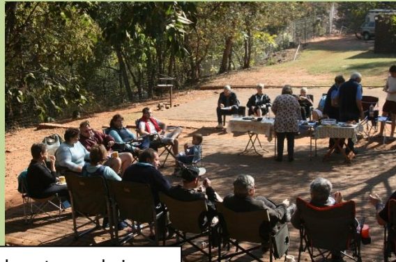
Sondag se koek en tee en kuier