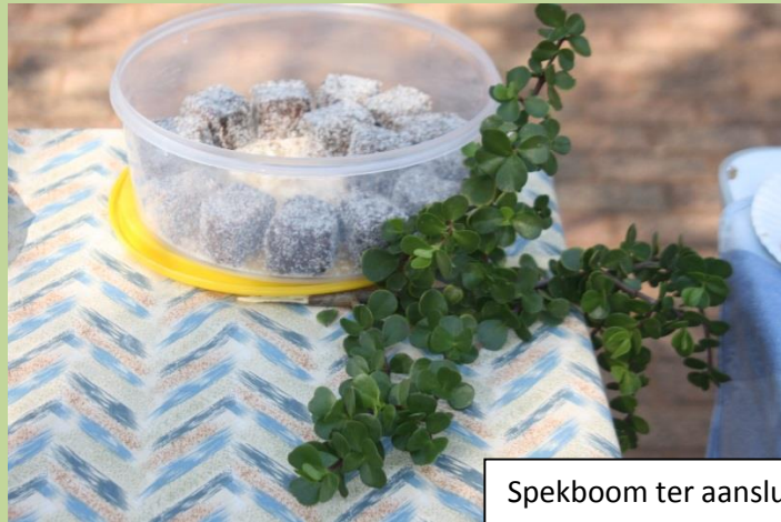
Spekboom ter aansluiting by Elmarie se boekevat.