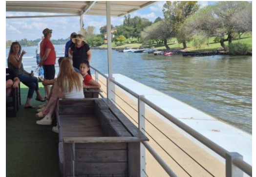
Terugvaart - Gauteng oewer regs

Die musiek was duidelik op die oewer hoorbaar, al het die bote aan die Gauteng-kant van die rivier gevaar.