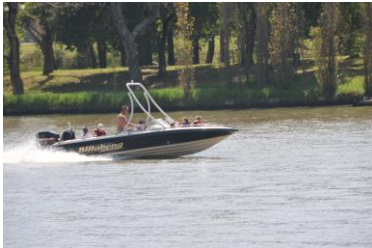
Plesierig stroom op

dat verkeersreëls op die rivier streng toegepas word. Dit bepaal onder andere dat motorbote teen 'n "beskaafde" spoed by plesierbote sal verbyvaar. Dit was nogal opvallend hoeveel motorbote lywige klankstelsels aanboord het.