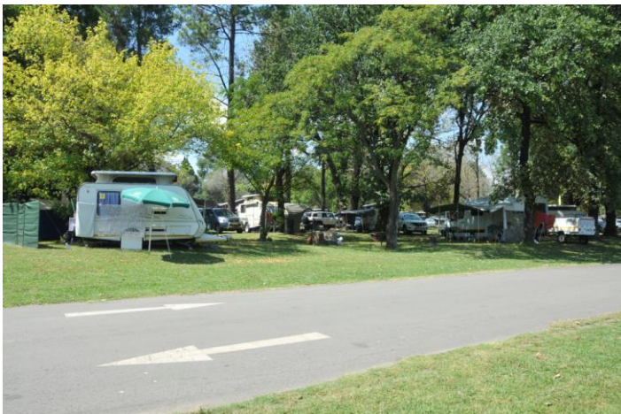
Rietvallei by die Paasfees

'n Seniorsaamtrek was aangebied van 31 Maart to 2 April en dié het met minimum ophef geskied. Hoofsaaklik boekevat saans en boekevat met afsluiting Donderdagoggend en baie kuier. 'n Groep van Gebied Goeie Hoop het die saamtrek bygewoon, as deel van 'n uitgebreide toer van die Kaap af, wat ook 'n besoek aan Botswana ingesluit het. Die groep het Maandag vertrek, met Zeerust as die volgende oornagpunt. Dit is omtrent 281 km van View on Vaal af en 'n gerieflike geskatte 3½ uur se ry.