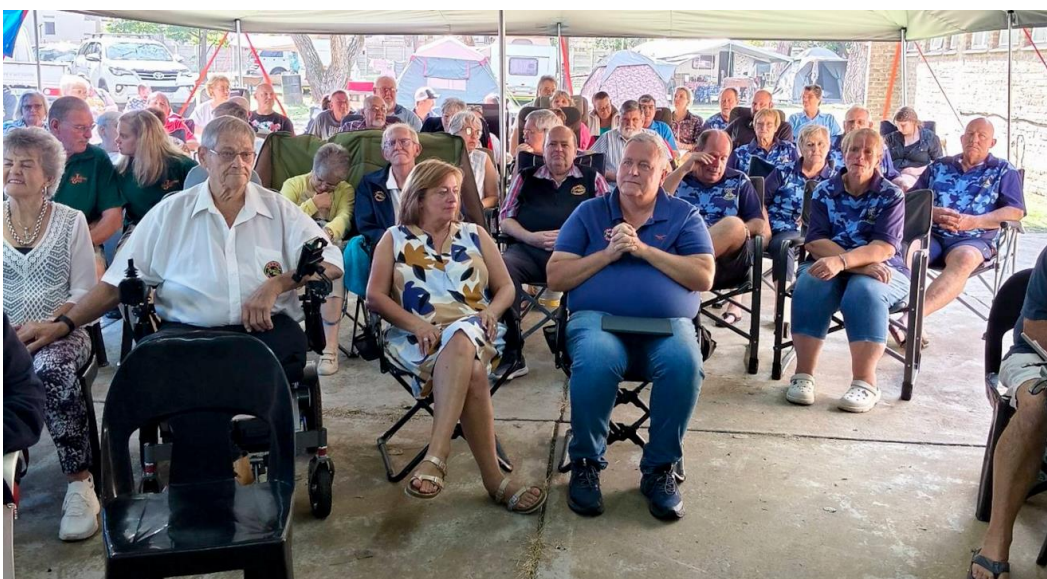
SAWAnante by Vrydagoggend se erediens