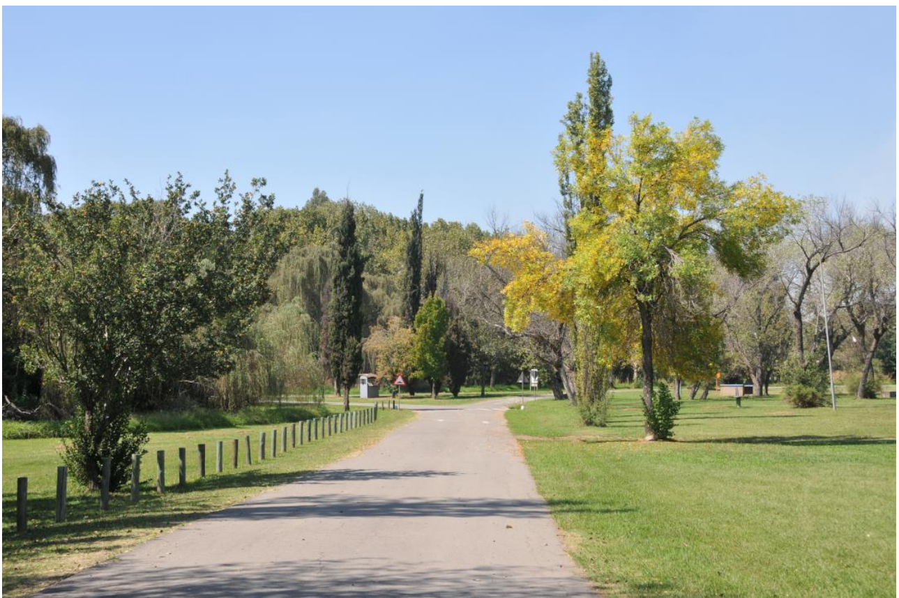
Herfskleure by View on Vaal, Sasolburg