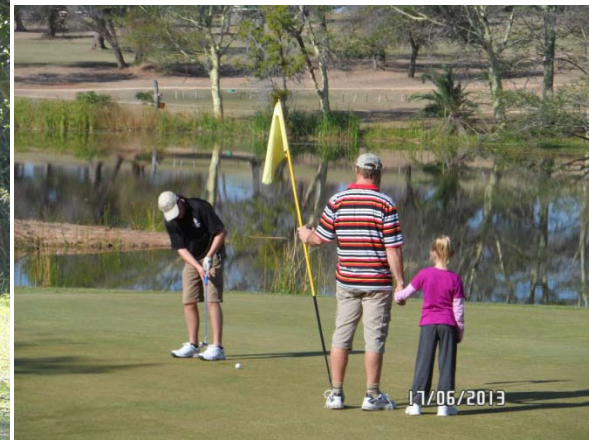
Sink hom Willie!!