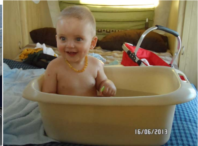
So bad mens lekker as jy kamp