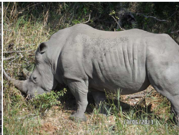
Wonder hoe lank gaan ons dit nog kan sien?