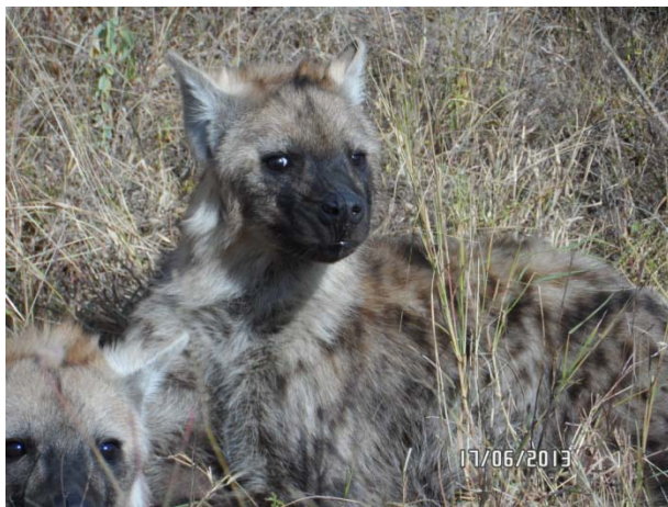
Ons gelukkie oppad uit