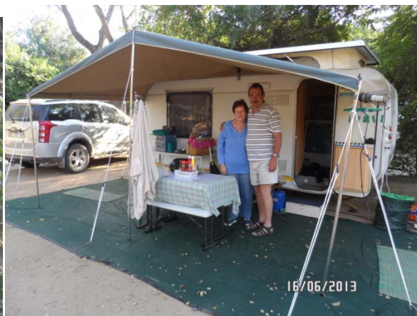
Nuwe motor en nuwe karavaan! Lekkerrrrr