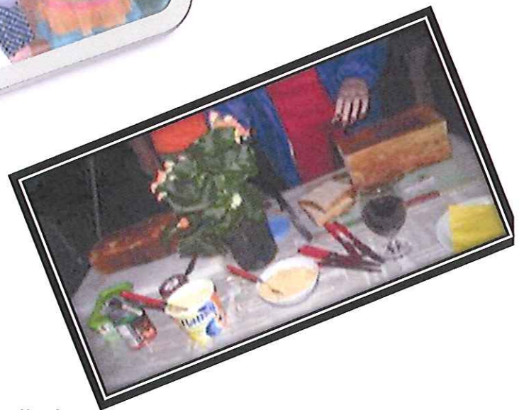
Brode om elke lus te blus

My stokkie brood is tog langer as jounel!