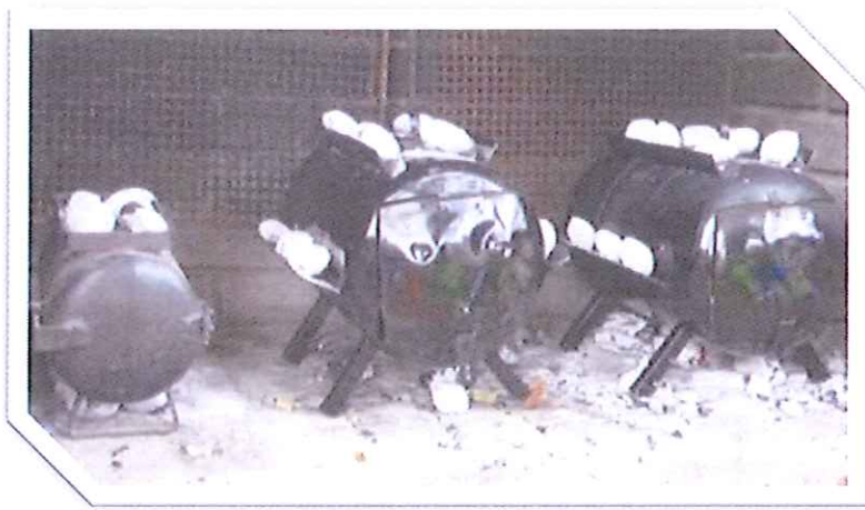
Broodjies & oondjies op 'n ry.....