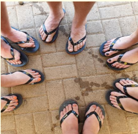
Nou wie s'n is wie s'n?