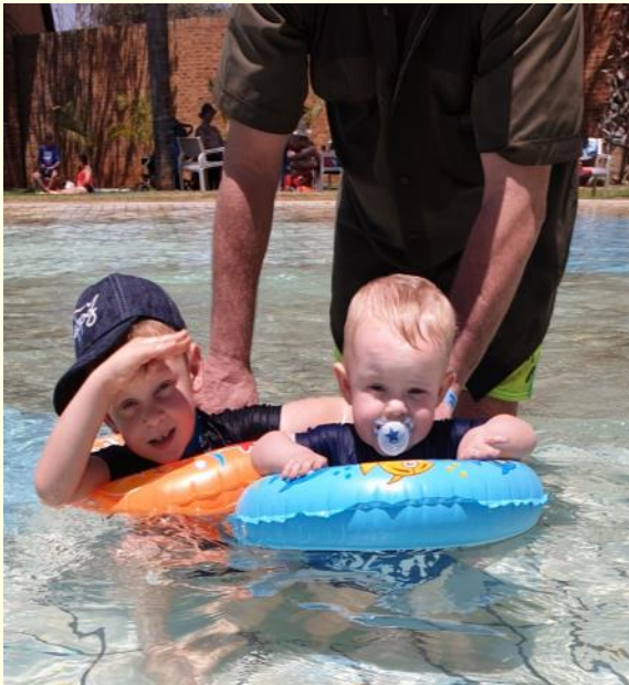
Hierdie Sawanantjies het die swembad baie geniet