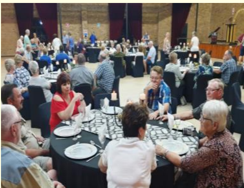
Sawanant-feesgangers sit heerlik en kuier by die verjaarsdagvieringe

◀ Die tafels was stylvol gedek en het pragtig vertoon ▶