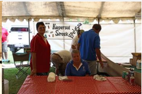
Koeldrank verkope tydens die kermis