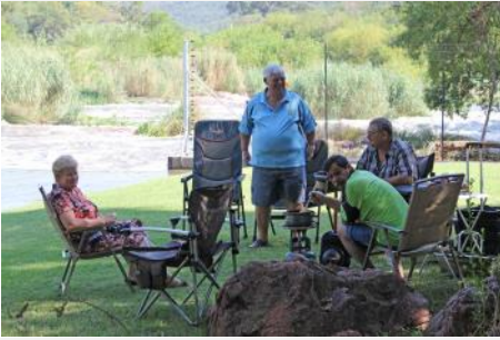
Ontbyt langs die rivier