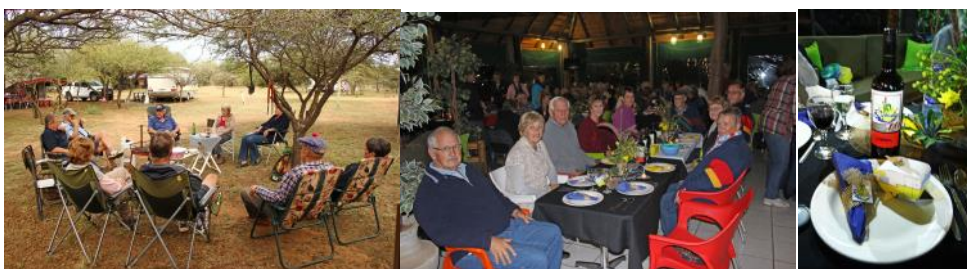
Kiepersollers kuier gesellig saam tydens Streek Rietvallei se 10de verjaardag saamtrek