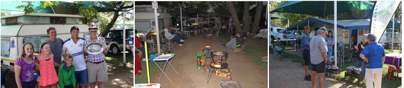
Sawanante en gemeentelede het baie lekker saam gekuier en gebraaai.