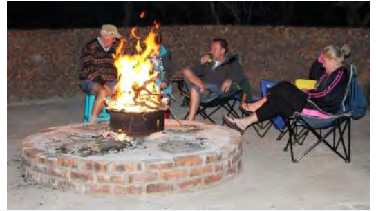
Die van Biljon familie kuier gesellig saam