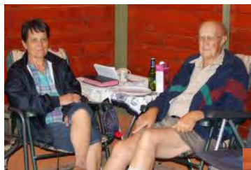
Links en onder: - Gesellige saam kuier tydens die naweek