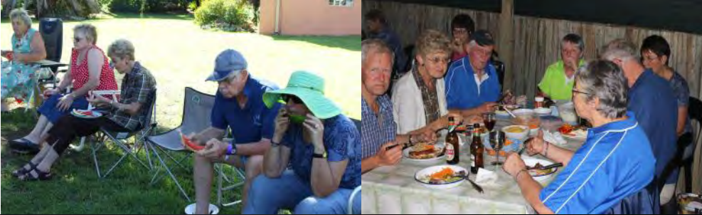
Bo, Links en onder: - Gesellige saam kuier en aktiwiteit tydens die naweek