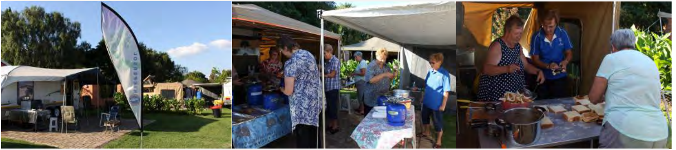
Kiepersol se dames besig om Jafels te bak Vrydag middag