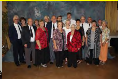
Bywoon van Dinee