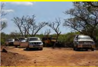
Foto Album - 4x4 Saamtrek - Marula / Thaba Monaté