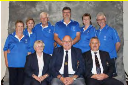
Bywoon van vergadering