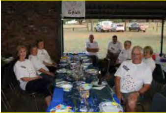
Kiepersol "Smarties" by ons tafel