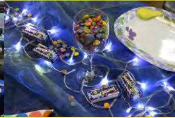
Versierings op die tafel