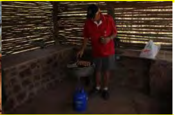
1. Pit Stop 2. Die Jeep sleep die Ford uit die modder 3. Hein se Path Finder grou dat dit bars 4. Middagete in voorbereiding