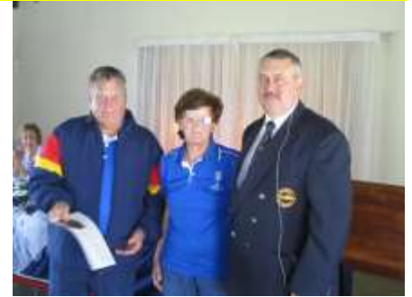
Martiens & Bets Joubert Streek Ere Hoër Graad