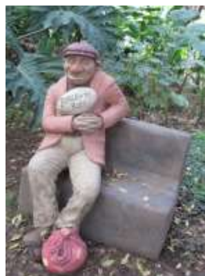
Die beeldjie in die Tuin van Eden spreek boekdele