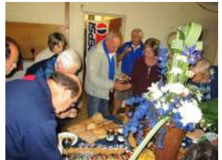
Informele Kaas & Wyn Dinee Heerlik voorbereide voedsel