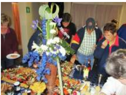
Informele Kaas & Wyn Dinee Heerlik voorbereide voedsel