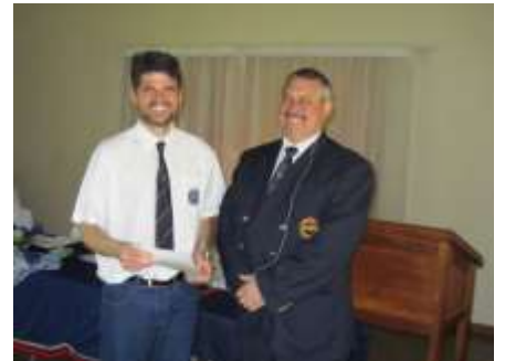
Rigard Lemmer Streek Meriete