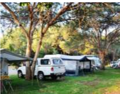
Hartbeespoort: Deel van die kampterrein