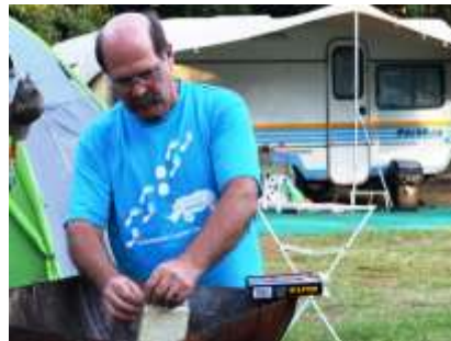
Kokkie steek die braaivleisvuur aan