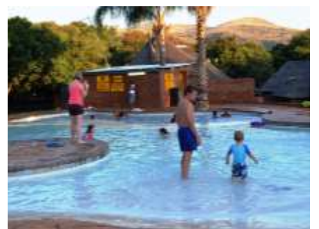
Die swembad het deur die hele naweek goeie aftrek gekry