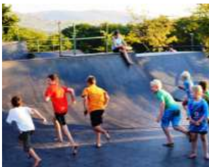
Kinders geniet hulle gate uit as daar nie fietse op die baan is nie