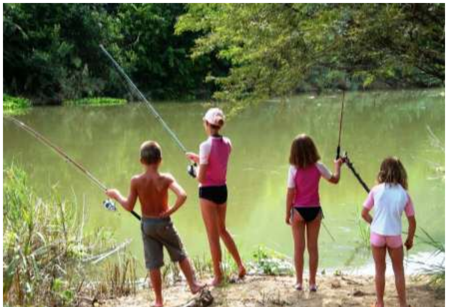
Daar is vis in die Krokodilrivier, dis net skaars