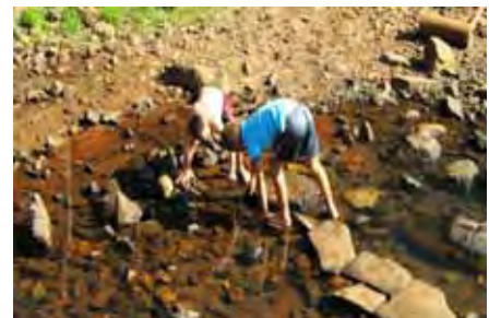
Jong seuns besig om krappe in die rivier te vang wat deur die oord loop