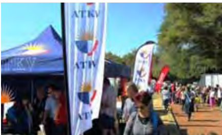
Die ATKV is 'n belangrike borg wat ook Sondag die Christusfees aangebied het