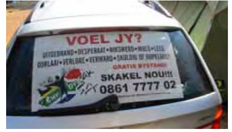
Hierdie BMW met raad vir die vermoedides en belastes is in die kamp opgemerk