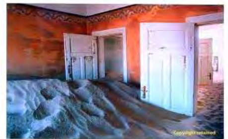
Kolmanskop; Sand dring huis binne

Hierdie was vir hom ‘n hemel op aarde, wat deesdae gemis word deur mense wat, dikwels onwetend, op die tolpad verbyskiet op ‘n dulle gejaag na nêrens! Soos Suze Orman sê: “Life is not about counting money. It’s about letting every moment count”.