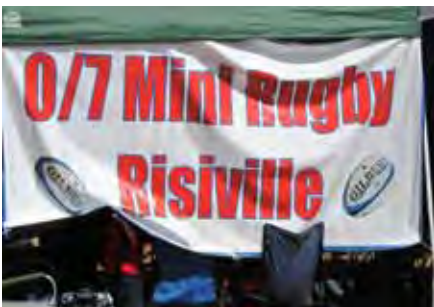
Mini Rugby vir die klein kanneljies is 'n ernstige saak