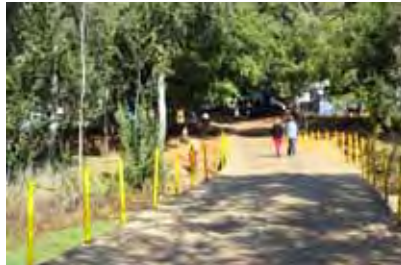
Twee wandelaars op die brug-gie oor die rivier