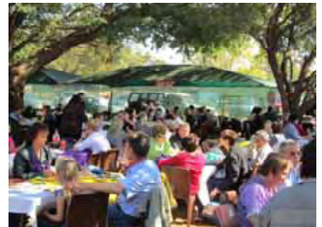
Mense eet Sondag middagete onder die bome