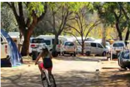
Daar was skaars plek vir 'n fiets-gewees