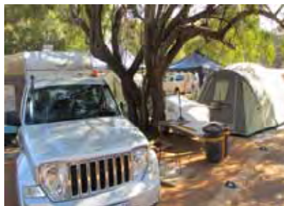
Deel van die volgepakte kamp-terrein