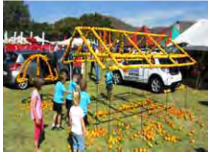
Hierdie afdakkie is met lemoene versier, kyk hoe baie het afgeval of is afgepluk