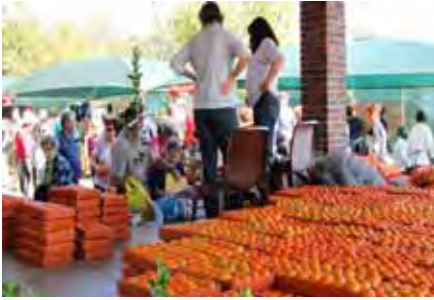
Daar was lemoene en nartjies vir Afrika, en so lekker soet!