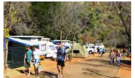
Die woonwapark is mooi geleë met die berg in die agtergrond