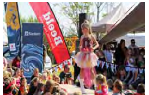
Een van die jong modelle wat op-getree het