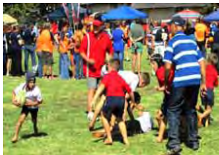
Hierdie jong knaap met die skrum-pet breek weg met die bal, oppad doellyn toe