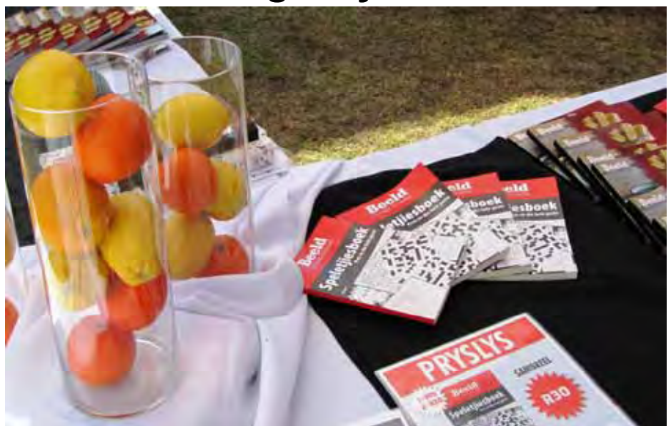
Hierdie vase met vrugte was by die onlangse Sitrusfees, wat op Buffelspoort gehou is, te sien