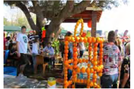
Nog 'n staander wat uit lemoene gemaak is