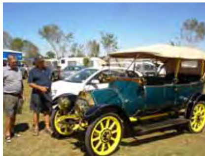
Hierdie motor uit die jare toet het groot belangstelling uitgelok