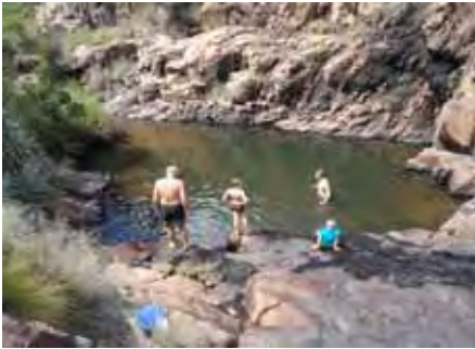
Die koue water word by die 4x4-saamtrek aangedurf