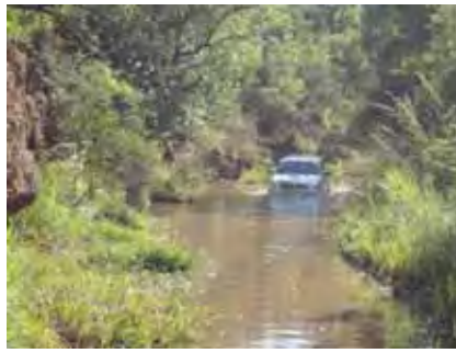
Die 4x4-manne en vroue moes ook deur diep waters gaan