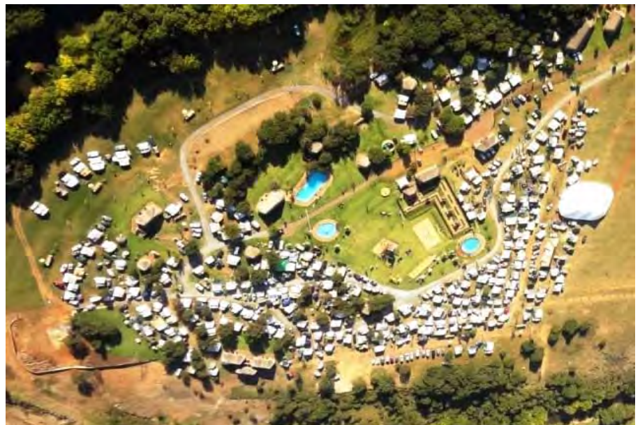
Lugfoto van Presidente-saamtrek wat oor die Paasaweek gehou is