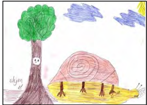
- Tekening deur Nicolaas Wheeler