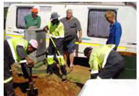
Die eienaar en werkers besig om nog 'n kragkabel te lê