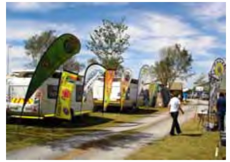
Baniere verwelkom ons by die Presidente-saamtrek