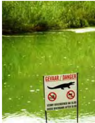
Daar is 'n krokodil in die rivier!