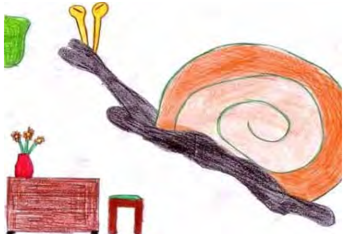
-Tekening deur Juan van Wyk

"Nee, jy is die slak. Jou stem is fyn en sag. Ons sal nie vir jou oopmaak nie," antwoord die slim wolfie. Hy is al te trots op homself dat hy geweet het dis die slak. 'n Rukkie later klop iemand weer aan die deur. Weereens vra die wolfie, "Wie is dit?"