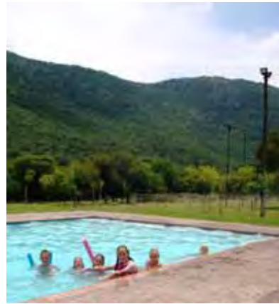
Mense baljaar in swembad met Ouberg in die agtergrond