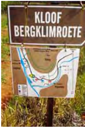
Party het die Kloof-roete aangepak