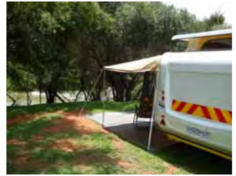
Ons het op die wal van die Krokodilrivier gekampeer