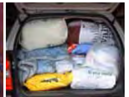
Een van vol vragte

▲ Van die mense by die Ark wat baat vind by die beddegoed. Die inwoners het begin tuinmaak tussen die houthuisies ▶