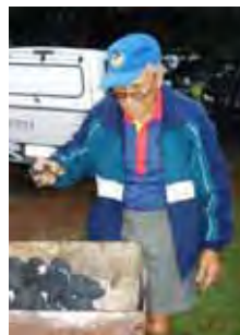
Gert Rall se vuur