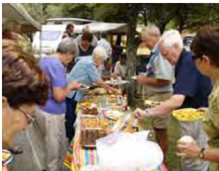
Soos altyd het die tafel gekreun van al die lekkernye by Sondag se tee