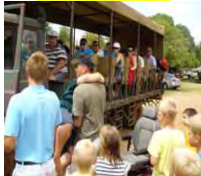
Saterdagoggend was daar 'n uitstappie na 'n nabygeleë krokodilplaas