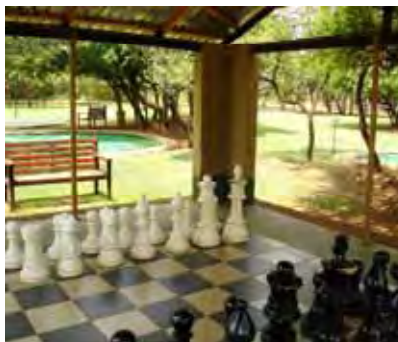
Daar kan ook skaak gespeel word