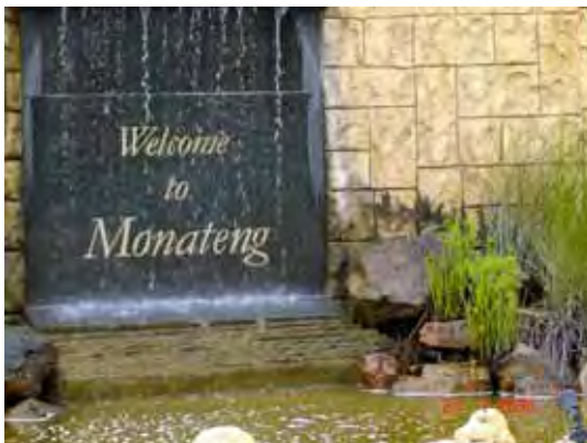
Ons was baie welkom by ons eerste Saamtrek vanjaar