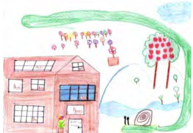
-Tekening deur Emma Swiegelaar