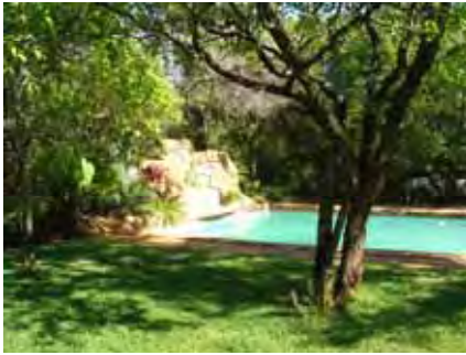
Die mooi swembad tussen groot skadubome