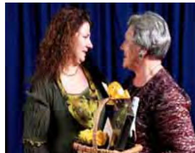
Sawa-vrou van 2011 word deur Sawa-vrou 2010 geluggewens