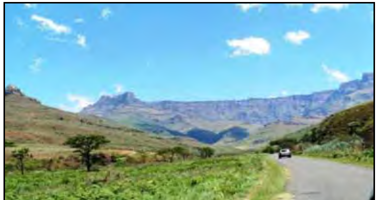
Roekie Hill het hierdie foto geneem naby die Hlalanathi-kamp