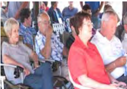
In afwagting dat die ereediens Sondag in die lapa moet begin