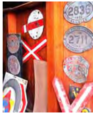
Hierdie spoorwegtekens dateer uit die jare toe ons nog baie trein gery het