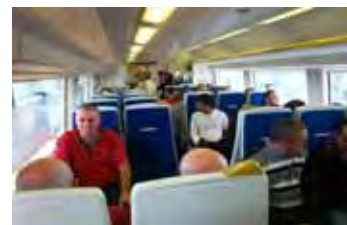
Lugverkoelde Gautrein binne