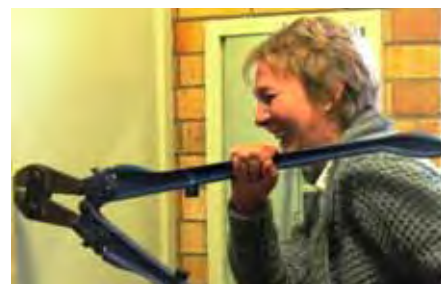
Ina het 'n probleem met 'n sleutel wat in die kas toegesluit is

Die organiseerder van die Aardklop-uitstappie