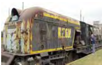
Garret-lokomotief het werk