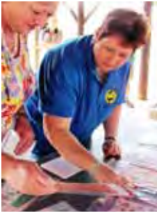
Die 3D-kaartjies word beoordeel