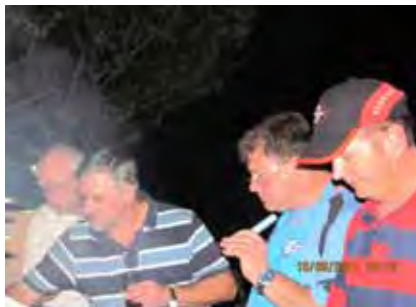
Hierdie vleisbraaiers neem hulle taak ernstig op!