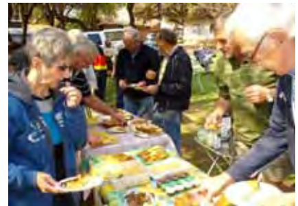
Die verversingstafel is soos gewoonlik baie goed ondersteun!