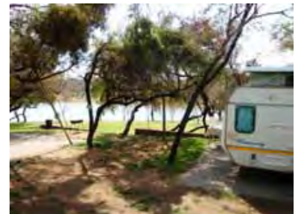
Mooi kampterrein langs een van die damme