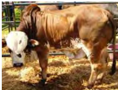
Hierdie Nguni-Afrikaner bulletjie het baie geld vir die basaar verdien