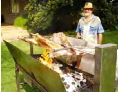
Fanie Marx is tevrede met die braai