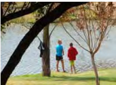
Hoopvolle vistermanne geniet die lekker weer