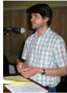
Rigard lewer verslag oor die finansies