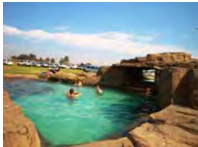
Die nuwe warm swemgat by Klein Paradys is deeglik ingewy