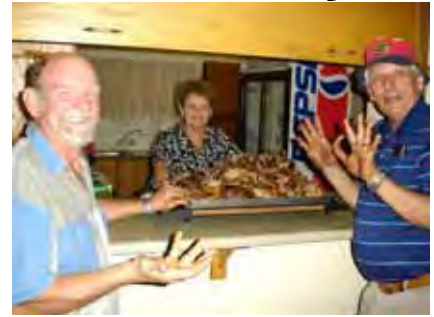
Kyk, ons het nog al 10 ons vingers!