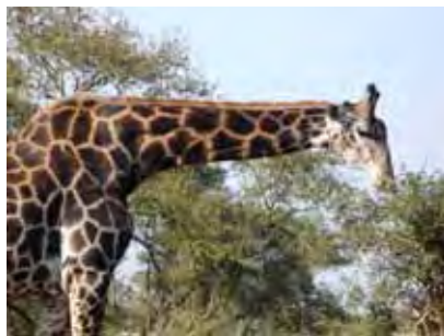
Hierdie keer eet hy laer