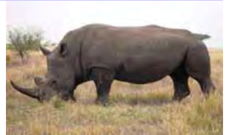
Renoster ou maat