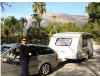
By Manoutsa met berg agter

Die konvooi van meer as twintig woonwaens het op 4 Junie vanaf Nkwe vertrek en die aand by Manoutsa, 'n boomryke oord by die Olifantsrivier naby Hoedspruit, oorgegaan. Sondagoggend was die rit tot by die Orpenhek van die Nasionale Krugerwildtuin (NKW) nie te ver nie en Satara sou vir vyf nagte ons tuiste wees. Daarna was dit vier nagte by die pragtige Letaba - kamp voordat