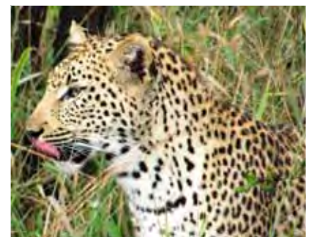
Kyk hoe lek hy sy lippe af!