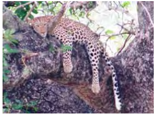
Dikgevrete luiperd in 'n boom