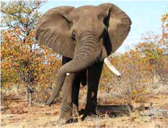
Dit lyk of dié ou grote vir die kamera poseer