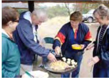
Jannie se moerby-gereg

die groep na Swadini vertrek het. Na die Noordelike Presidente die naweek is huiswaarts gekeer.