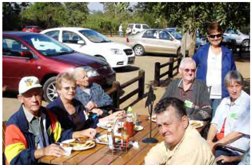
’n Groepie Kiepersollers en vriende eet ontbyt by ’n piekniekplek in die Nasionale Krugerwildtuin tydens die onlangse toer