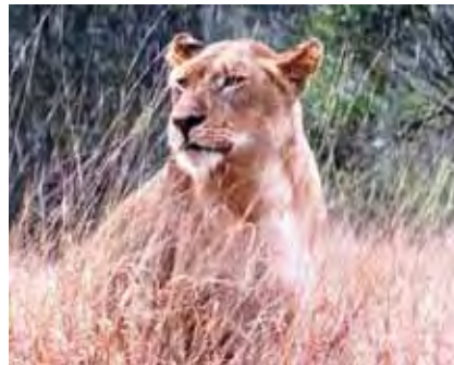
Die een lyk gesteurd