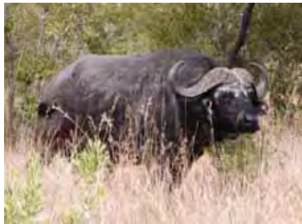
Buffel se kind