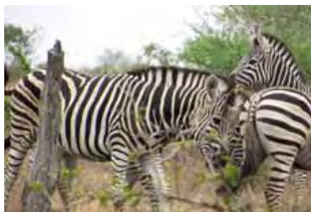
Die sebras bly maar mooi