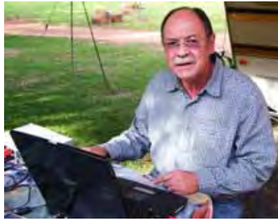
Schalk Nolte wat weer sy gewilde musiekspeletjie aangebied het