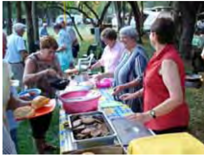
Alles gereed en die kliënte begin om elkeen sy eie hamburger te bou. Dit het groot aftrek gekry