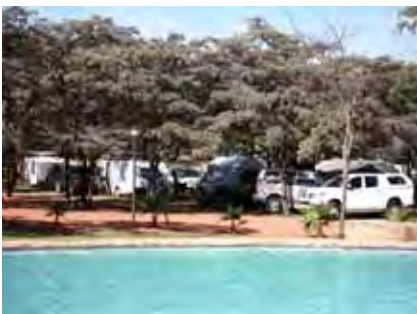
Woonwaens onder bome by swembad te Mopani