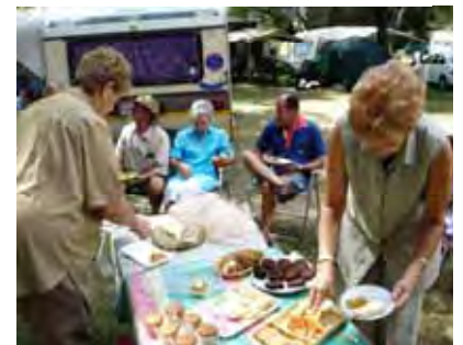
Kiepersollers drink tee en eet koek soos wat dit die tradisie is