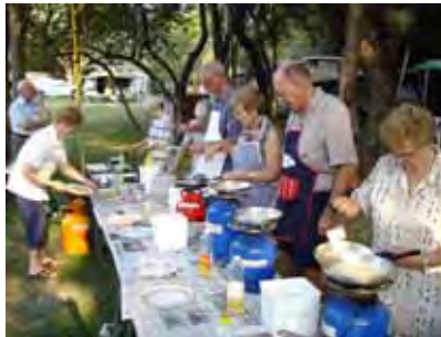
Waterbergers het die lekkerste pan-koek gebak. Dit was al vroeg Saterdagoggend beskikbaar