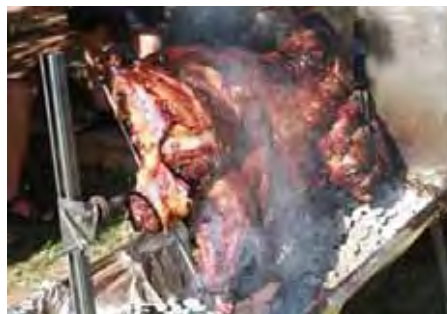
Pierre Wilsenach het 'n spitbraai by die 100+ gehou