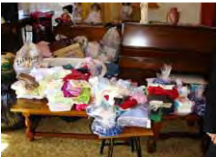
Daar is baie klere vir deur hulp-behoewendes geskenk