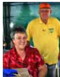
Bo is die miernes van bedrywighede tydens Saterdagoggend se kermis