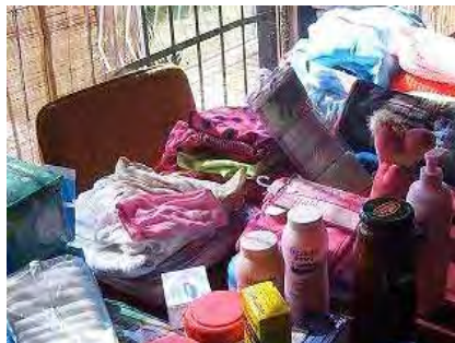
Veral babaklere is gebring en aan Mariana oorhandig