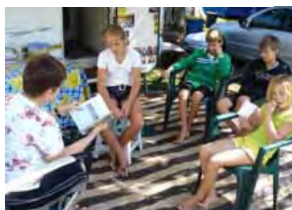
Alet besig met die kategese-klas Sondag voor kerk