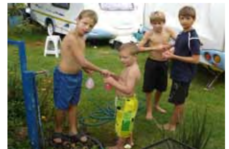
“Kinders moet nie in die water mors nie...”