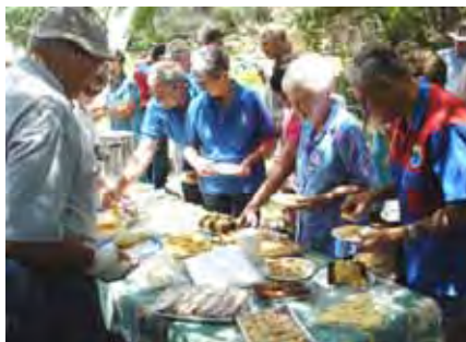
Sondag se teetafel by die afsluiting was soos altyd gewild