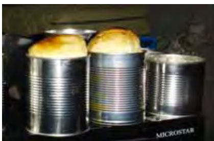
Betsie se broodjies in blikkies